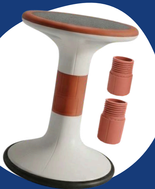
Réf : MOBI-TWIST-TERRA