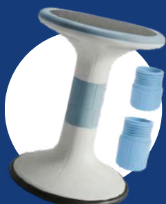
Réf : MOBI-TWIST-BLEU