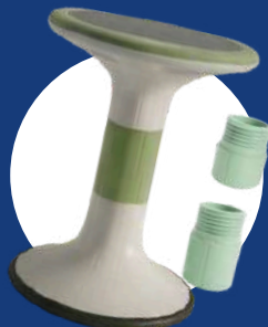
Réf : MOBI-TWIST-VERT