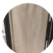
Doublure intérieure en tissu métallique