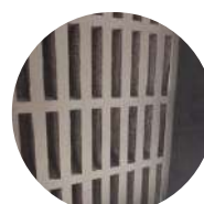
36 Emplacements numérotés pour une gestion simplifiée